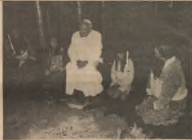
Ten komunisty nenávidený papež Jan Pavel II. v lese medzi Indiány za své loňské návštevy Kanady.

My mladí ČSSR Vás naliehavo žiadame, aby ste takýmto akciám rozhodne zamedzili. Žiadame Vás, aby Cirkev v ČSSR si mohla sama rozhodovať kam patrí. My mladí