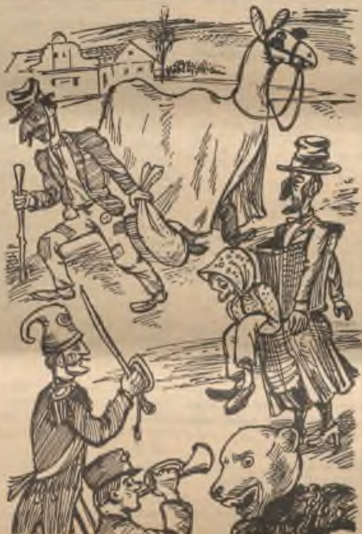
Masopustní maskary z doby našich rodičů, babiček a dědů, kteří slavili masopust opravdu zveselá! Dokážeme to ještě dnes? No jistě, samozřejmě! Jen se z jejich tašankových napadů trochu inspiřujeme. Přijďte k nim i své vlastní a v sobotu 16. února v masce veselé hurá - do chicagského „Velehradu“ na Mumraj!

Jak vidíte, snažíme se pro vás připravit opravdu veselou a