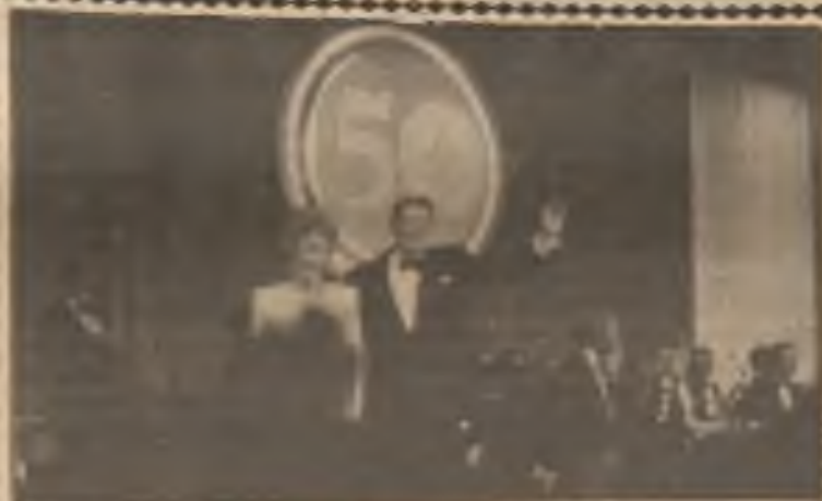
President Ronald Reagan s choti Nancy zdraví účastníky washingtonského plesu, pořádaného u příležitosti lednového nástupu 2. vládního presidentského období.

from utopian dreams. There seems to be a widespread realization that human nature cannot be perfected, or permanently suppressed.