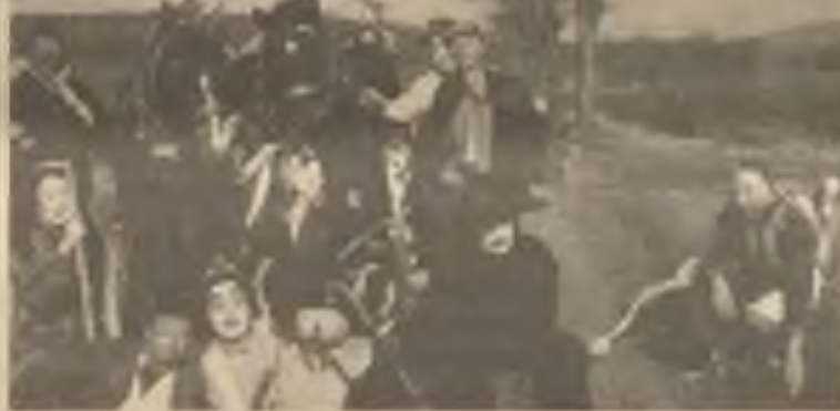
V minulém čísle Hlasu Národa jsme měli obrázek masopustních máskar z doby našich rodičů, babiček a dědič, abychom vám připomněli, jak veselo se u nás slavíval stročeský masopust a „navnadili“ vás, abyste letos na náš maskární masopustní Mumraj přišli maskovaní. Dnes přimíšme důkaz, že masopustní veselí u nás doma stále ještě vládne. Obrázek je z Pásečnic na Chodsku. Po našem letošním Mumraji, rádi bychom v H.N. uveřejnili také obrázek přítomných masek, které se jej dovádělivě zúčastnily. Máte již připravenou masku, ve které půjdete? Chceme konec letošního masopustu oslavit opravdu skotačivě a hodně veselo, jak se to sluší a patří. Proto se rozpomeňte na svou bujarou nápaditost svých mladých let a při volence budete radostně překvapeni, když se přesvědčíte o tom, že Vás v masce nemohli poznat ani Vaši nejbližší známí! Těšíme se a těšte se už s námi na rozdováděně veselou náladu masopustního Mumraje.

Zakupte si lístky předem, rezervujte si stoly a přijďte jistě! Těšíme se na vás!