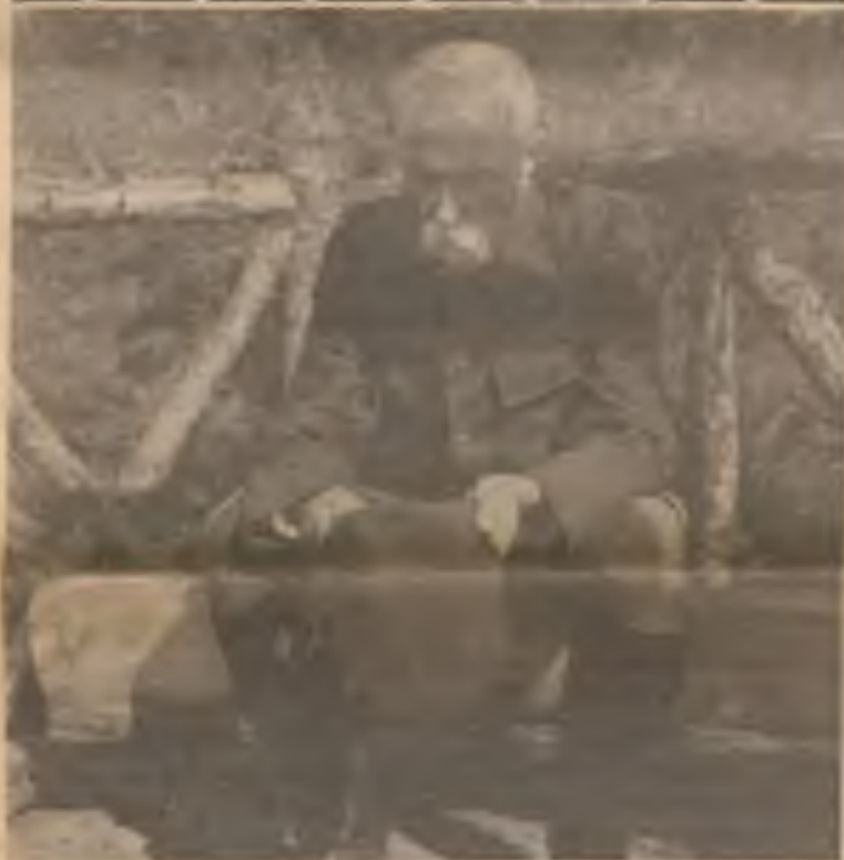
President T.G. Masaryk ve chvílích zamyšlení a rozjímání v Topolčankách na Slovensku na podzim r. 1930.