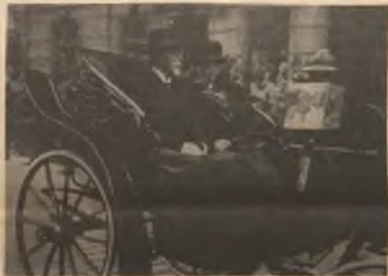
President TGM s předsedou vlády Antonínem Švehlou 27. května 1927, když byl ve svých 77 letech zvolen po třetí prezidentem ČSR.