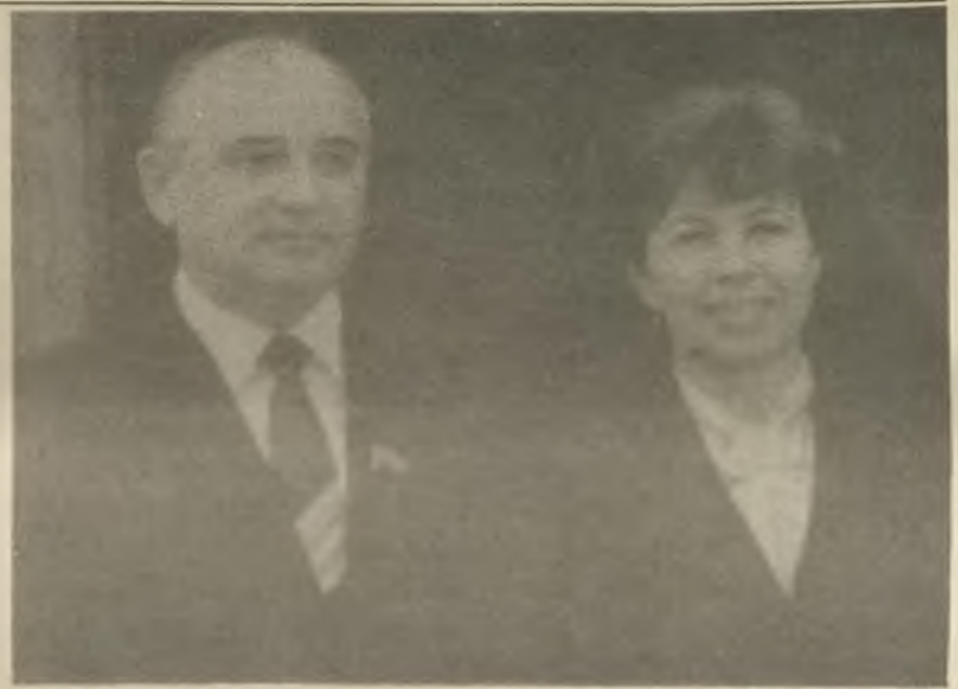
Nový sovětský generální sekretář komunistické strany SSSR, Michail Gorbačev se svou ženou Raisou za jejich společné návštěvy Anglie v minulém prosinci.

někoho mladšího, a tak už v pondělí 11. března celý svět věděl, že starý lišák Andrej Gromyko doporučil svým kolegům 54 letého Michala Gorbačeva, kterého předtím poslal „na zkušenou“ do Kanady a do Anglie, aby se přesvědčil o jeho vystupování a „účinku“ na západní veřejnost. A když pak Gromyko k své nesmírné radosti zjistil, že Gorbačev udělal dobrý dojem i na „železnou dámu“ Anglie, konzervativní Thatcherovou, pronesl velkomožně svým kolegům v politbyru známá slova našeho Kecalá ze Smetanovy Prodané nevěsty „hotovo je, hotovo“, a v křesle na věky odešlého Černěnka byl posazen usměvavý Michal.