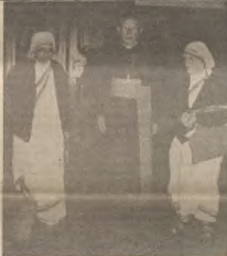
Pražský arcibiskup František kardinál Tomášek s etih Matkou Terezu z indické Kalkuty a její spolusestrou, která ji doprovázela při předvánoční návštěvě v Praze a v Brně.

Teprve za první republiky a zvláště po Eucharistickém sjezdu v r. 1935 se vztahy mezi Vatikánem a ČSR téměř úplně