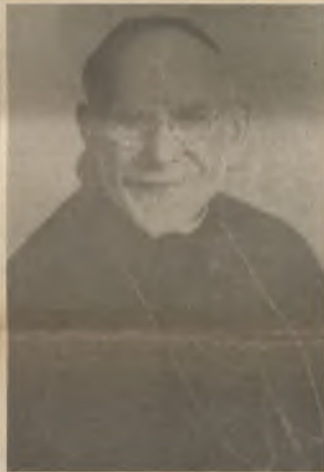
Njd. Otec Prokop Nežil, O.S.B., zakladatel českého bened. tisku a 3. opat.