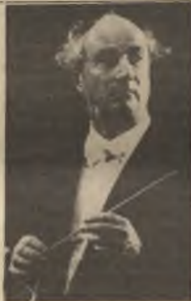
Mistr Rafael Kubelík

Zároveň ovšem - a to je ten druhý zvláštní rys nedávného chicagského vystoupení - dirigent se představil jako skladatel ve světové premiéře své skladby „A Symphonic Peripetia for Organ an Orchestra“ /1984/. Monumentálně koncipovaná symfonická skladba, bohatě využívající rytmické pestrosti i instrumentace /vedle varhan připomeňme si zvlášť působivé uplatnění saxofonu/, usiluje postihnout jedno z největších dramát tohoto světa: životní cestu člověka poznamenanou zvraty, peripetiemi, ale i vyústěním v jistoty řádu a ve vnitřní vyrovnaní. Není proto náhodou, že se skladba svým titulem i svým rozvíjením ve čtyřech částech hlásí k tradici těch projevů lidského umění, které nalezly klasický výraz v řecké tragedii. Toto pojetí i jeho umělecká realizace vyvolaly už při premiéře skladby vysoké ocenění u chicagských kritiků. Shodně vyzdvihují hluboce humanitní dosah tohoto hudebního díla. R.C. March napsal: „It is precisely the sort of music I would expect Kubelík to write, a