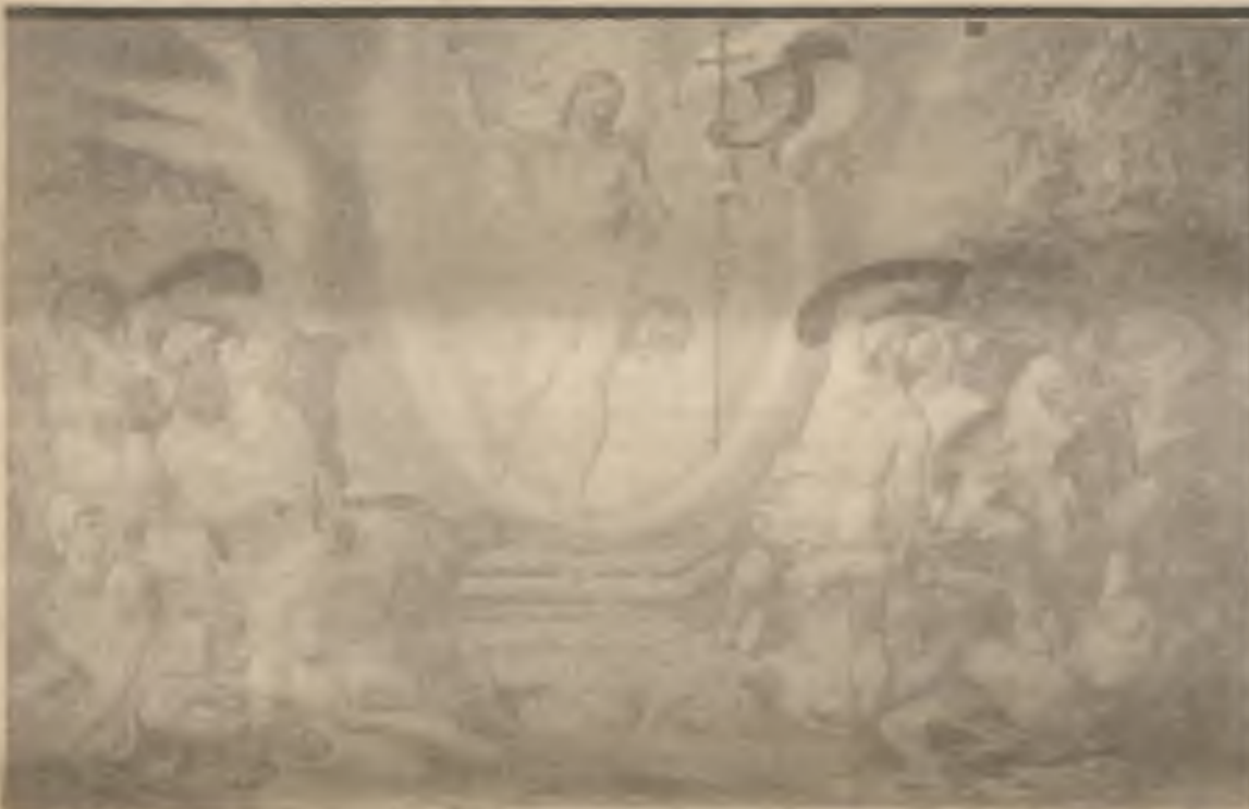
Hendrick van Den Broeck: Kristovo vzkříšení v Sixtinské kapli ve Vatikáně.