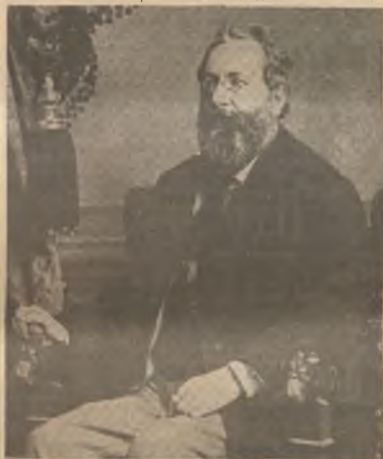
... a básník Jan Neruda, který se v Praze narodil 10. července 1834, byl už rok starý a pokoušel se o první krůčky k maminčině židli.