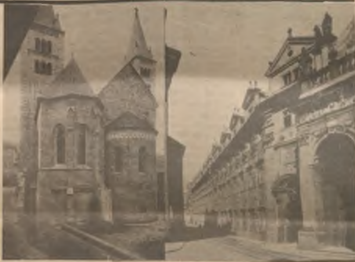
Před 150 lety stála na Hradčanech basilika sv. Jiří s hrobem sv. Ludmily, aby bděla nad Prahou, stejně jako dnes. ... a v Královské ulici v blízkosti kostela sv. Salvátora (naproti Staroměstské věži Karlova mostu) - byly ještě v Klementinu posluchárny bohoslovecké univerzitní fakulty.

Most velký pouze jeden, kamenný, t.j. Karlův most, k jinému spojení obou břehů sloužily 3 veřejné převozy, u Vyšehradu, od Újezda a od