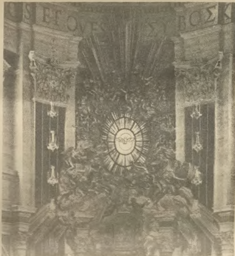
Symbolické znázornění Ducha sv. na nadoltárním okně absidy hlavní lodi svatopetrské basiliky v Římě, kde tuto sobotu 25. května přijme 28 nově jmenovaných kardinálů z rukou sv. Otce Jana Pavla II. své insignie: purpurový biret a kardinálský klobouk. Jak už víme, bude mezi nimi i náš slovenský arcibiskup Jozef Tomko a stane se sekretářem vatikánské Kongregace pro šíření víry ve světě (misii). — Vzpomeňme v modlitbě! — Tu holubičí z okna svatopetrské basiliky - symbol Ducha sv., si dal i náš exilní Otec biskup Jaroslav Škarvada do svého znaku titulárního biskupa litomyšlského.