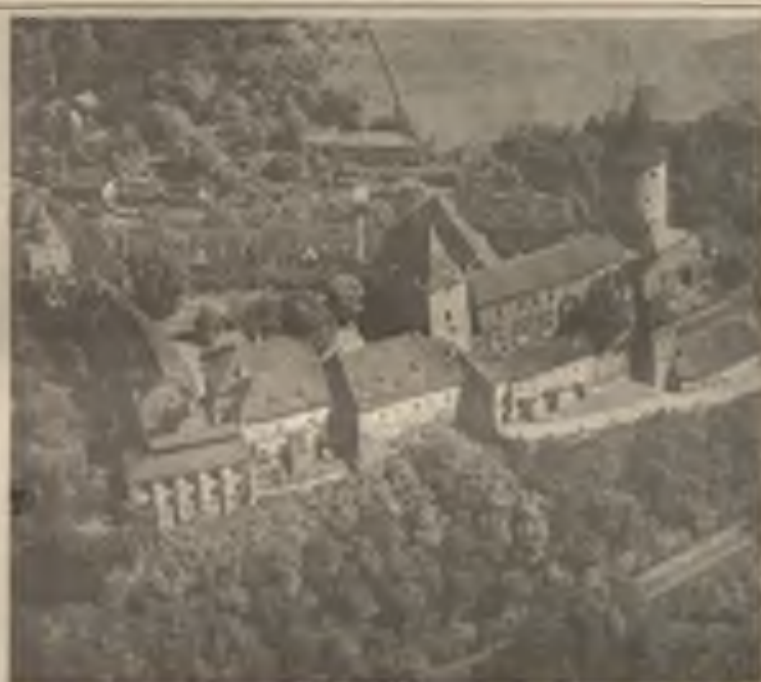
Hrad Křivoklát uprostřed hlubokých lesů západně od Prahy sahá svým počátkem až do 12. stol. - Dnešní podobu mu vtiskla pozdní gotika za krále Vladislava II. v letech 1493 až asi 1522. Dnes je ve velkém sílu paláce umístěna trvalá výstava pozdně gotické deskové malby.

Po létech, vrací se k hradu, pocítil jsem neobyčejně silné vzrušení. Hledě k tomuto obrazu již od nádražička, byl jsem žádostiv obejmout celý hrad hned tím prvním a jediným pohledem, jak náhle obživil ze vzpomínek třicetiosmi nebo třicetidevítiletých. Aby se pře-