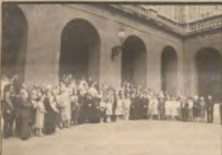
Americké a kanadské Slováky, kteří přijeli letos o Letnicích do Říma u příležitosti jmenování jejich rodáka Otce arcib. Jozefa Tomka kardinálem, přijal sv. Otec Jan Pavel II. ve zvláštní audienci v pondělí 27. května 1985.