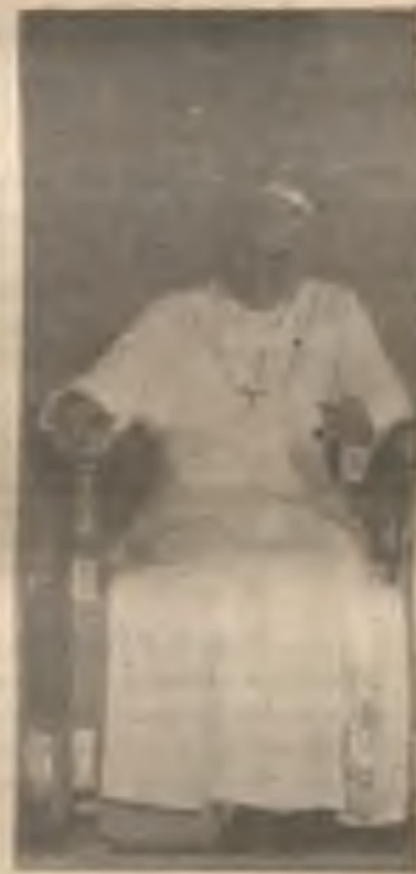
Otec kardinál J. Tomko při projevu... kterémž Sv. Otec pozorně naslouchal a pak osobitným slovenským pozdravil.