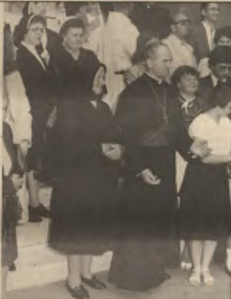
J. Emm. Jozef kardinál Tomko se svou šťastnou maminkou, která jediná dostala od čs. úřadů povolení jet do Říma na synovu slavnost.

b) Druhé poučení se týká přímo vašich osob jako kněží a řeholníků. Jak plyne z životopisu sv. Metoděje, tento světec měl dokonalou duchovní i kulturní přípravu na poli teologickém, biblickém i právním. To vše bylo spojeno s jeho ctnostmi, laskavou povahou a dohromady to bylo příčinou účinnosti jeho apoštolské práce. Nikdy nebude