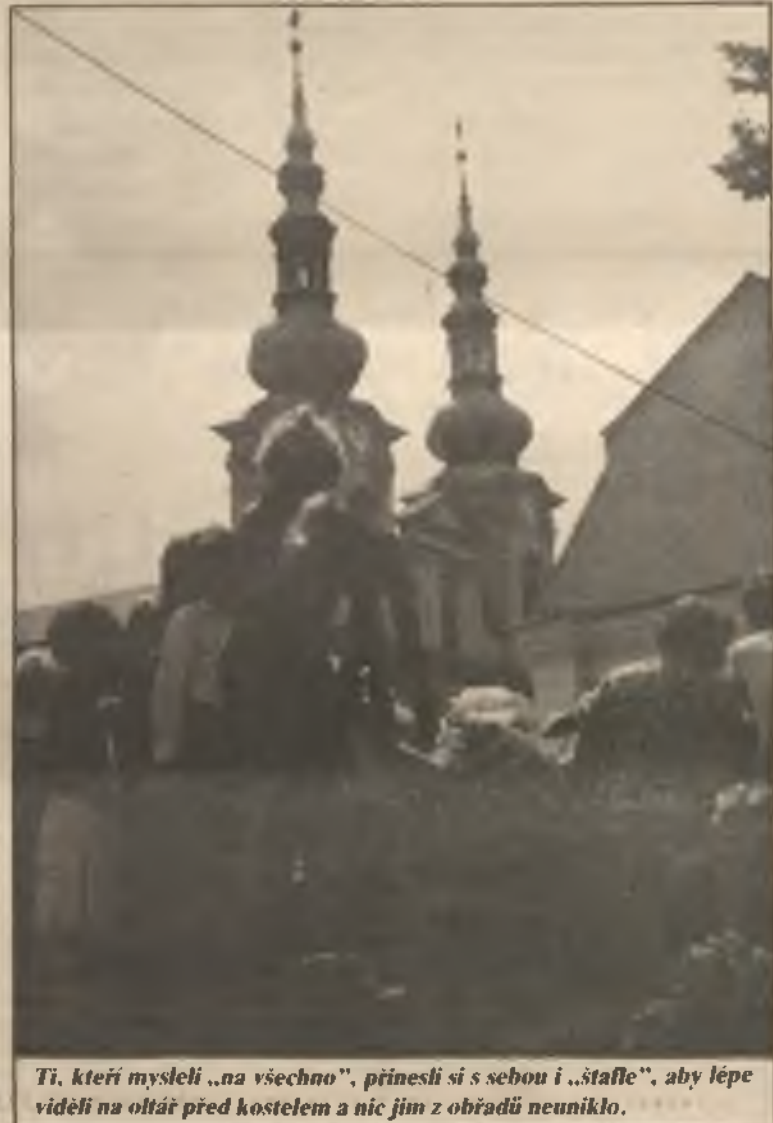
Ti, kteří mysleli „na všechno“, přinesli si s sebou i „štafle“, aby lépe viděli na oltář před kostelem a nic jim z obřadů neuniklo.