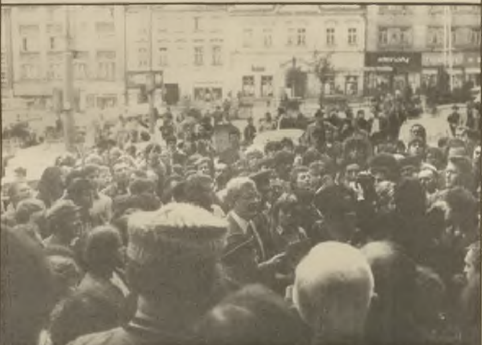
Ambassador Luers and U.S. Army Attache greet well-wishers in town square of Klatovy.