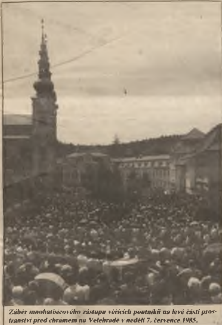
Záběr mnohatisícového zástupu věřících poutníků na levé části prostranství před chrámem na Velehradě v neděli 7. července 1985.