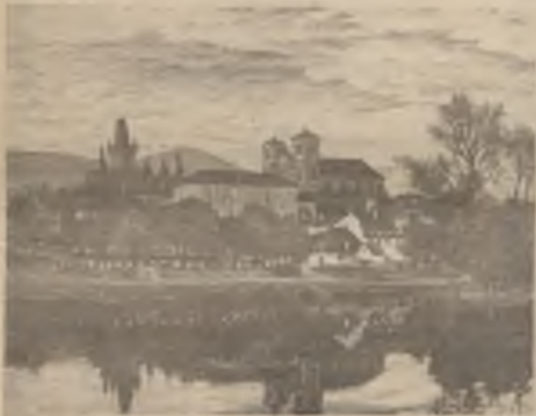
Litoměřice podle obrazu ak. malíře V. Malého; katedrála sv. Štěpána je ze 17. století (biskupství založeno r. 1665).

Za tohoto stavu se i církev (Pokračování na str. 5)