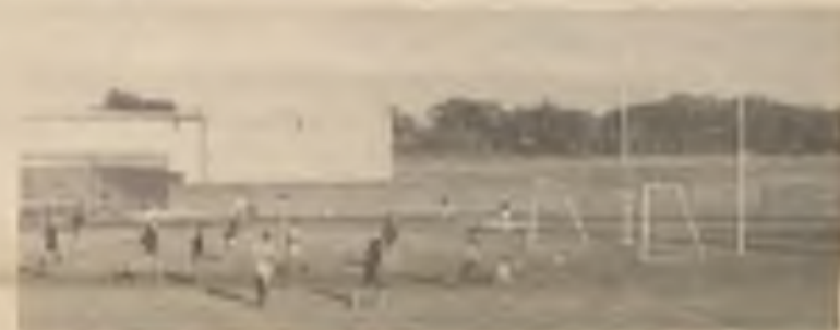
Druhý gól v sítí Chicago Sting.

Německa 7:5, 6:2. Devětadvacetiletý Složil obdržel za své vítězství cenu v hodnotě dvaceti čtyř tisíc dolarů.