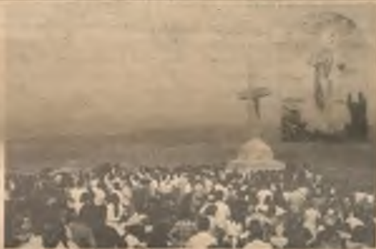
Pahorek PODBRDO - „Hora zjavení“ v jugoslávské visce Medžugorí s „Križovým vrchem“.

Naša pozornosť sa sústreďuje na farský kostol. Keby ste ho našli prázdny, ako kdekoľvek inde - veď neboli žiadne bohoslužby - iste by ste nikomu neuverili žiadne „rozprávky o zjaveniach“. No tu už sú ľudia, ktorí sa modlia, alebo čakajú na svätú spoveď, a to je ešte len asi desať hodín ráno. Výzdoba kostola je jednoduchá, nerozpyľuje a preto tu nevidíme to, na čo sme zvyknutí v chráme svätého Petra alebo iných veľkých chrámoch sveta - ľudí, ktorí hľadajú umelecké diela a nie Ježiša