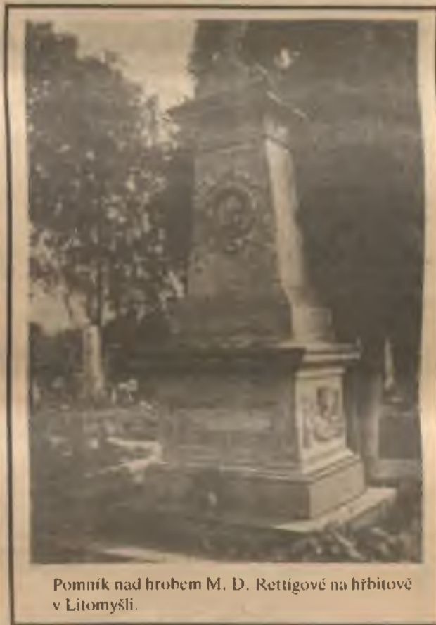
Pomník nad hrobem M. D. Rettigové na hřbitově v Litomyšli.

Stránka Rettigové „Malé domácí kuchařky“ s návodem jak připravit kapustu s masem.