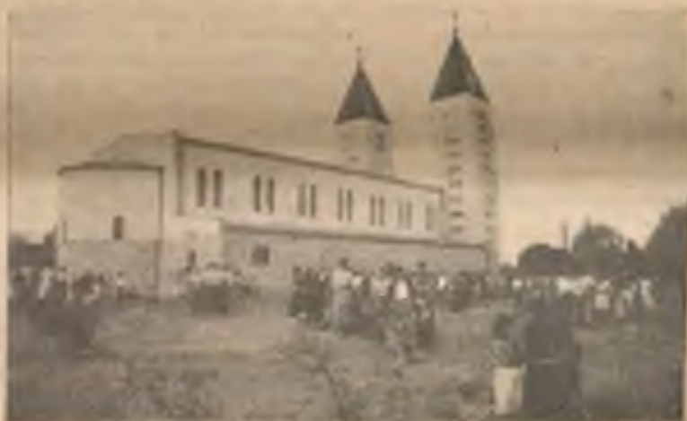
Nový farní kostol sv. apoštola Jakuba v Medžugorí v jugoslávské Bosně - Hercegině.