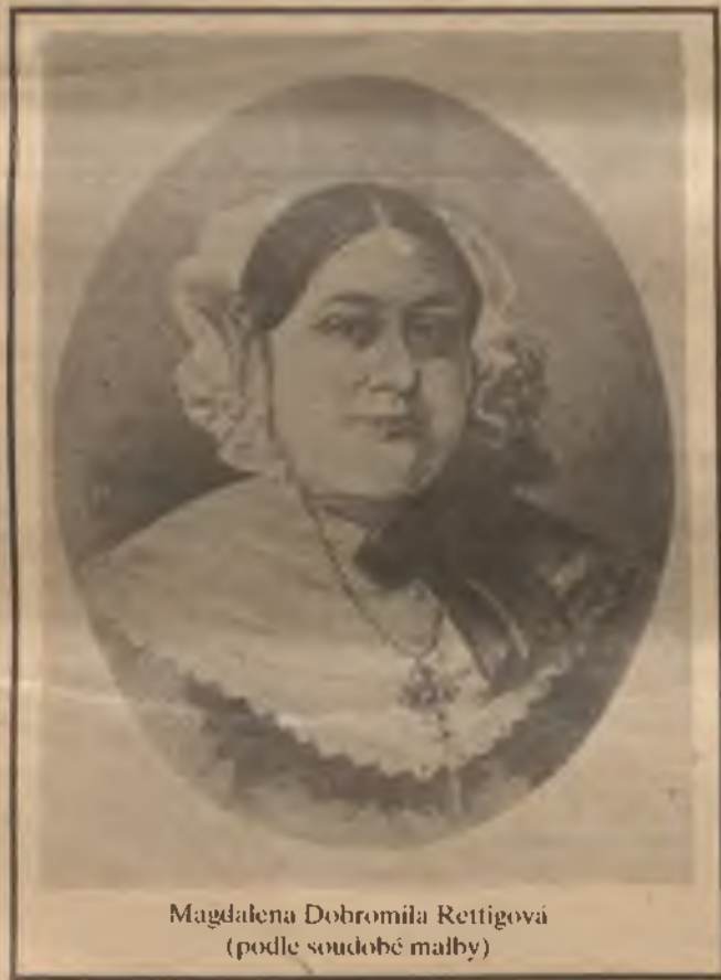
Magdalena Dobromila Rettigová (podle soudobé malby)