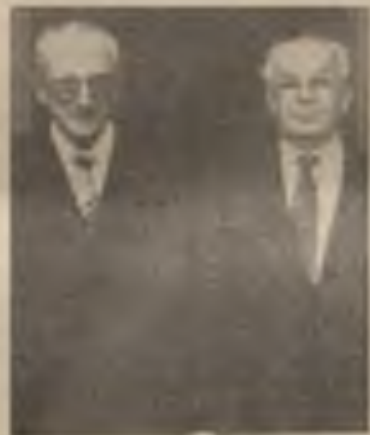
Dr. G. Husák s dnes už nežijúcim J. Andropovom.

Tretie kolo násilností trvalo tri mesiace, august, september, október 1951. Zase to isté týranie, dni a noci bez spánku a