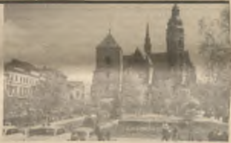
Na námestí v Košicích stojí výstavný chrám sv. Alžběty už od konce 14. stol. - A bude tam svědkom víry v Krista i pro generace příští, které nebudou už nic vědět ani o „Košickém programu“, ani o Husákově.