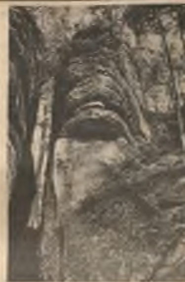
Vlevo: Budislavské skály podivuhodný útvar „Zvon“, zaklesnutý do rozsedliny v „Toulovcových maštalích“. - Nahoře: Jiná skalní partie z „Toulovcových maštali“.

nechal jim vystrojit velkou hostinu. Na stůl byly nošeny rozmanité pokrmy a pochoutky, některé z nich báby v celém životě dosud nikdy ani nejedly. Vína, piva a kořalky bylo habaděj. Ani na ovoce nebylo zapomenuto. Když již báby nemohly více jíst ani pít, a jen se blažeností usmívaly, zeptali se jich zemané, zda-li jsou s hostinou spokojeny.