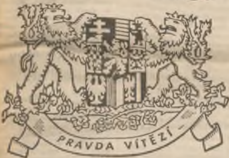
Původní Velký znak naší první Československé republiky.