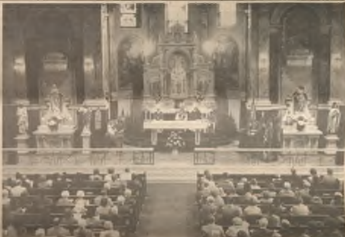
Zaber ze mše sv. v kostele Bl. Anežky České při oslavě 1.100. výročí smrti sv. Metoděje o Národním dni českých katolíků v Chicagu v neděli 6. října 1985.

Během celého roku až do všeslovanské poutě, konané v Římě v neděli 13. října, kterou svatý Otec Jan Pavel II. oficiálně ukončil svatometodějský rok konaly se na mnoha místech, kde pohromadě žijí naši lidé společně poutě, mše svate, přednášky a oslavy k uctění památky jubilea umrtí toho z našich věrozvěstů, který se svým bratrem sv. Cyrilem „přinesli nám Písmo svaté.“ Vzpomeňme znovu, jak spontánně svou věrnost víře manifestovali naši bratři a sestry doma na Velehradě. A my spojení s nimi a se všemi našimi bratry a sestrami roztroušenými po celém světě jsme věrnost tradici cyrilometodějské dosvědčili svou účastí a usebraností na českých bohoslužbách v kostele Blahoslavené Anežky České v Chicagu, jimiž byl Den českých katolíků jako již léta předtím v neděli v 10:30 A.M. zahájen. Vlastně můžeme říci, že naše oslava svatometodějského výročí započala naší pravidelnou sobotní českou večerní mši svatou u Panny Marie Svatohorské v Ciceru, kterou s