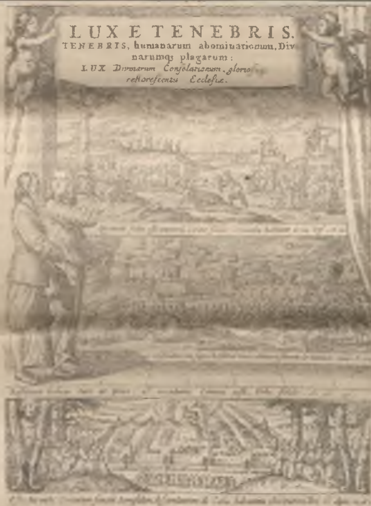
Titulní list Komenského spisu „Lux e tenebris“