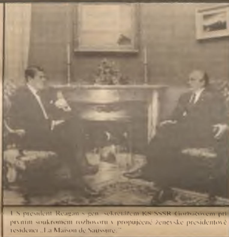
US prezident Reagan s gen. sekretářem KS SSSR Gorbačovem při prvním soukromém rozhovoru v propůjčené ženevské prezidentově rezidenci „La Maison de Suisse“.

na Západě více jasno i v řadách všech exulantů ze všech komunisty porobených zemí, aby Americe, Kanadě a celému svobodnému Západu pomohli svou solidaritou v pevném postoji proti lži-propagandě Kremlu a všech komunistických satelitních režimů. V době rozhodného ideového boje a hospodářského zápolení je třeba táhnout se svobodným Západem za jeden provaz a nechat si svoje národní a domácí stranické rozmišky z neporozumění na dobu, po návratu svobody do našich vlastí. Hospodářský, vědecký a technický pokrok je dnes na straně demokracie a svobody. Zpozdilost marxismu a hospodářské neúspěchy komunismu s jeho sociální diskriminací a rudým apartheidem nakonec zvednou pokořeným hlavu, a před číselnou převahou nespokojených si komunisté v zemích střední a východní Evropy už nemohou dovolit všechny postřílet, chtějí-li s hospodářsky prosperujícím Západem obchodovat. Celý ten vývoj pak může jednotný postoj všech exulantů ze všech porobených národů jen uspišit.