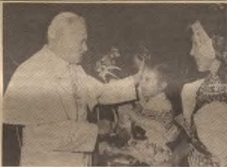
Svatý Otec Jan Pavel II. s dítětem našich poutníků při říjnové všeslovanské děkovné pouti na ukončení svatometodějského roku.

ekumenické jednoty na závěr roku sv. Metoděje. O apoštolské požehnání pro všechny prosil Jurij Sverdlovski Povenko, Sibír 8. září 1985. Obraz byl poslán prostřednictvím arcibiskupa z Bělehradu mons. Turka.