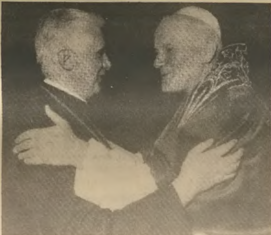
Svatý Otec v rozmluvě s kardinalem Ratzingerem, prefektem vatikánské Kongregace křesťanské nauky, kterého považují někteří páni biskupové v Holandsku, v Kanadě v Brazílii a v USA hlavně některé sestřičky za příliš „konservativního“, protože se poutivě modlí, zachovává si chladný rozum a dobrotu srdce vzdor všem jejím rozmarům současné doby. Svátý Otec však v něm má spolehlivého pomocníka.

Musíme totiž při tom padnout na kolena a prosit. A musíme s tím začnout nutně jen každý sám. I Otcové kardinálové, biskupové, my kněží, řeholníci a sestřičky, tak jako každý z lidí. Kdo jsme s tímto procesem duchovního dospívání dosud nezačali, nebo jsme se v něm v unavě života zastavili, máme příležitost s ním začnout, nebo znovu pokračovat o letošních vánocích u Kristových jeslíček. A to, na čem se dohodl světový synod biskupů letos v Římě, si přečteme někdy později.