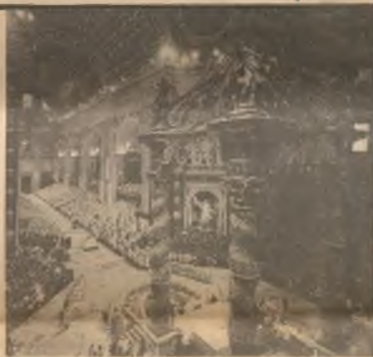
Záběr ze zasedání 2. Vatikánského sněmu před 20 lety.

To nejtežší a nejpotřebnější, co měl papež Jan XXIII. zvláště na mysli, když všeobecný sněm v roce 1962 svolával, je zřejmě stále ještě ve vyvoji a bude to trvat další desetiletí, než toho bude dosaženo v daleko větší míře. Šlo mu totiž hlavně o dosažení větší a upřímnější lásky mezi křesťany, o živý