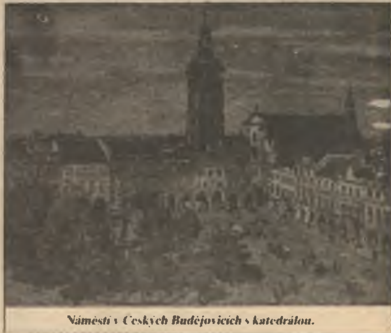
Náměstí v Českých Budějovicích s katedrálou.

Podíváme-li se na statistiku, vidíme situaci dostatečně jasně. Vraťme se ještě tedy o několik let nazpět. Poněvadž jsem neměl k dispozici dost dostupného materiálu, uvádím čísla z prvních let 20. století. Na 427 farností bylo v těchto letech 855 diecézních kněží a 134 řeholníků. Řeholníci měli své domy a kláštery roztroušeny po celém kraji. Vzpomenu alespoň na některé, jež se zapsaly do historie. (Dokoncem na str. 11)