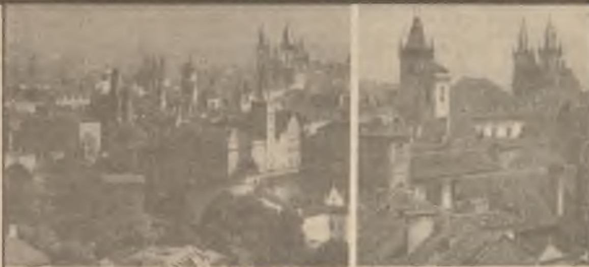
DVA ZÁBĚRY Z PRAHY, SEIFERTOVY CELOŽIVOTNÍ LÁSKY.

Rodná země s hřejivou láskou přijala tohoto svého milujícího a milovaného syna. My v cizině jsme se v tesklivém rozjímání znovu zamýšleli nad jeho působivými, lahodnými verši „Písně o rodné zemi:“