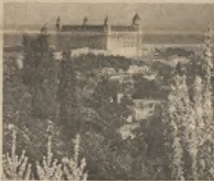
Obnovený hrad Bratislavy.