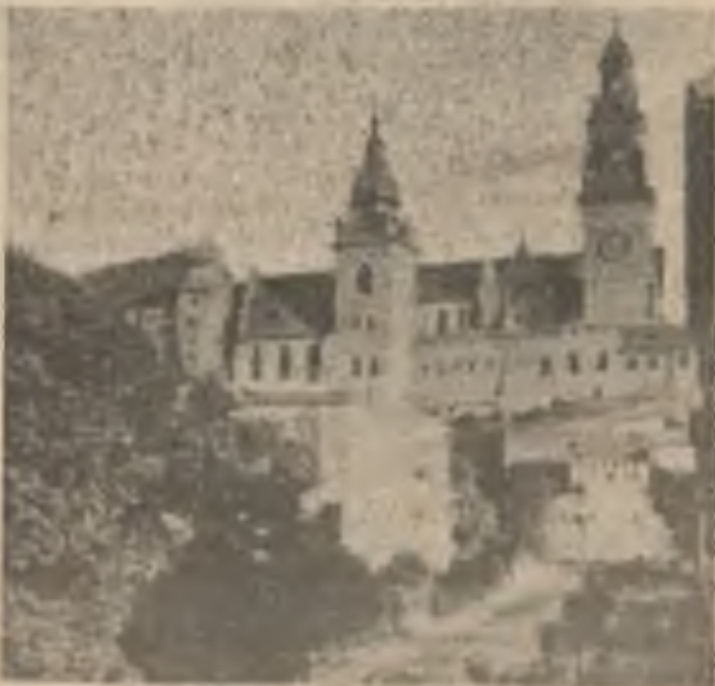
Katedrála sv. Václava v krakovském „Wawelu“.