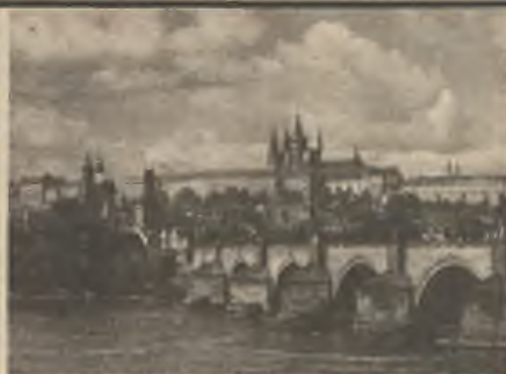
Známé panorama Prahy, Karlova mostu a Hradčan.

V Československu a v Polsku přes hranice, které mezi našimi národy staví jejich komunistické vlády, českoslovenští a polští kritikové a oponenti komunismu jsou v úzkém myšlenkovém, duchovním - a jak dosvědčuje několik schůzek mezi zástupci Charty 77 a hnutí KOR - i v osobním styku. Za Pražského jara polští studenti volali „Cala Polska czeka na swego Dubczeka“. Sympatie, se (Pokračování na str. 13)