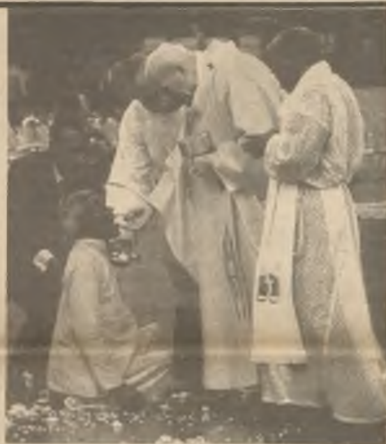
Při své desetidenní misijní cestě přes celý podkontinent Indie začátkem letošního února svatý Otec v New Delhi obětoval mši svatou za náboženskou snášenlivost a mír v této zemi, prosycené krví starých náboženských bojů. — Náš obrázek jej zachycuje při rozdělování svatého přijímání chromým a nemocným.

idárnost s 2,000 lidmi, kteří zahynuli v roce 1984 ve městě Bhopal jedovatými plyny z továrny firmy Union Carbide, vyrábějící odhmyzovací prostředky. Shromážděným katolickým kněžím ze státu Goa řekl, že v Indii - „zemi gurů a moudrých“ - jsou lidé hluboce nábožensky založení a čekají od kněze, aby byl jako guru, opravdu mužem božím, vyzávajícím ze sebe veškerým jednáním své přátelství s Bohem. Musejí být skutečně muži modlitby, z níž pramení všechna jejich práce. - Dne 7. února papež navštívil ještě také město Trichur, ležící 1,300 mil jižně od New Delhi, kde - podle zbožné tradice - apoštol sv. Tomáš zahájil svou apoštolskou činnost v Indii asi 19 let po Kristově ukřižování a zmrtvýchvstání. Tam jej přišlo uvítat na 300 tisíc lidí. Podle místní tradice jeho motokáru doprovázelo osm pestře ustrojených slonů.