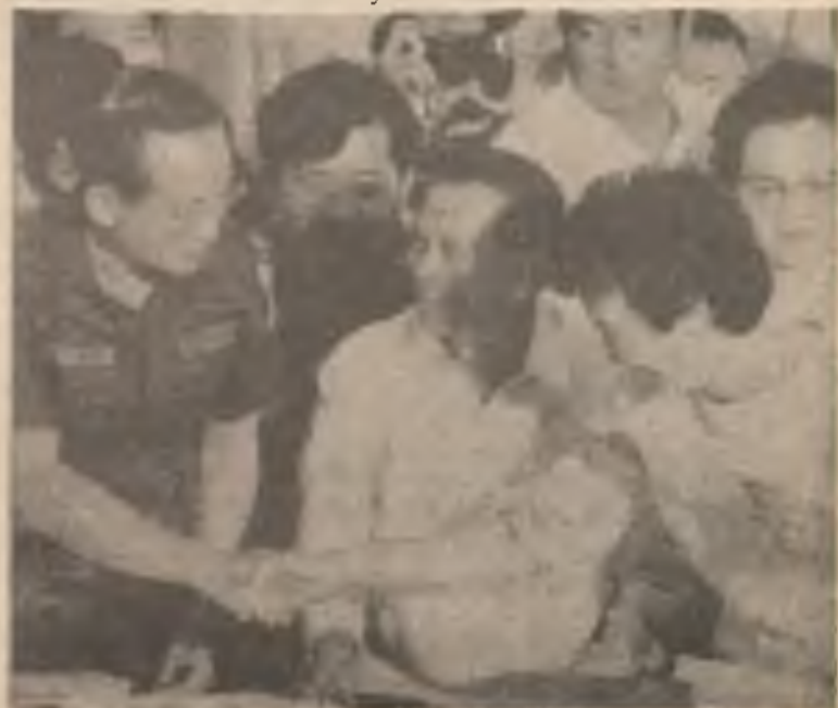
...a takto se domlouvala o vítězství demokracie na Filipínách v úterý ráno 25. února 1986 Corazon Aquinová se svými politickými kolegy.

Ovšem, na Filipínách to ani nová vláda nebude mít lehké! Nezaměstnanost, vysoká inflace, veliký zahraniční dluh, chudoba a dosud stále trvající komunistická rebelie. I když, členům marxistických guerillů nabízí Aquinová amnestii, ti nejfanatičtější se jen tak k její vládě a politice nepřikloní. Hlavně však, že netekla na Filipínách krev nevinných, že strach z toho, co bude zítra, netrval mezi lidem dlouho, a že mají nyní všichni chuť k svorné práci na obrodě země. Držme jim proto upřímně palce, a ti z nás, kdo věříme, pomodleme se s nimi, aby k tak nekrvavé změně poměrů mohlo dojít jednou i u nás doma.