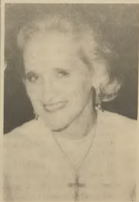
Tvým věrným, Bože, smrt život nebere, ale jen proměňuje v život věčný s Tebou...

Podle křesťanské nauky je poměr k lidem a ke světu odleskem osobního poměru k Bohu. Je tedy jasné, že se bez náboženství lidské vztahy nezlepší, že se nedosáhne solidárnosti mezi lidmi bez vědomí společného Božího synovství.