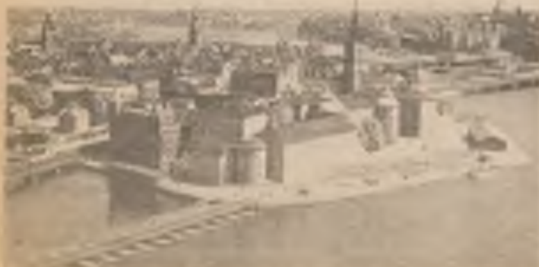
Stará čtvrť Stockholmu, v jejíž jedné uličce byl Olof Palme zastřelen.

švédskou politickou opozicí a má od svých politických začátků dobré a přátelské vztahy s představiteli federace dělnických odborů, které jsou druhou polovinou - (vedle Soc. dem. strany) - vlivné politické moci dělnického hnutí v dnešním Švédsku. Proto, když se sešel výkonný výbor švédských sociálních demokratů, aby se jeho členové dohodli na výběru jejich kandidáta, který by nastoupil na Palmeho předsednické místo jak ve straně tak ve vládě, usneshli se na společném prohlášení členům strany, že v současné době je jediným kandidátem na nástupnictví v úřadě předsedy strany a vlády po tragicky zesnulém Olofu Palmeovi jen Ingvar Carlsson. Až bude před 14. březnem uveden do svého úřadu, bude už pátým předsedou švédské Sociálně demokratické strany od jejího založení v r. 1889. A v okamžiku, kdy tuto zprávu dokončujeme je už jisté i to, že bude i novým předsedou nové švédské vlády.