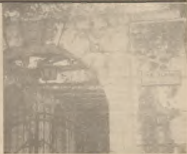
„The Alamo“ - kolebka texaské nezávislosti.

Obléhání začalo. Generál Santa Anna a jeho 2500 útočníků po tři dny ostřelovali opevněné Alamo a jeho posádku, čítající 174 mužů. V čele posádky stáli tři muži: jedenač-