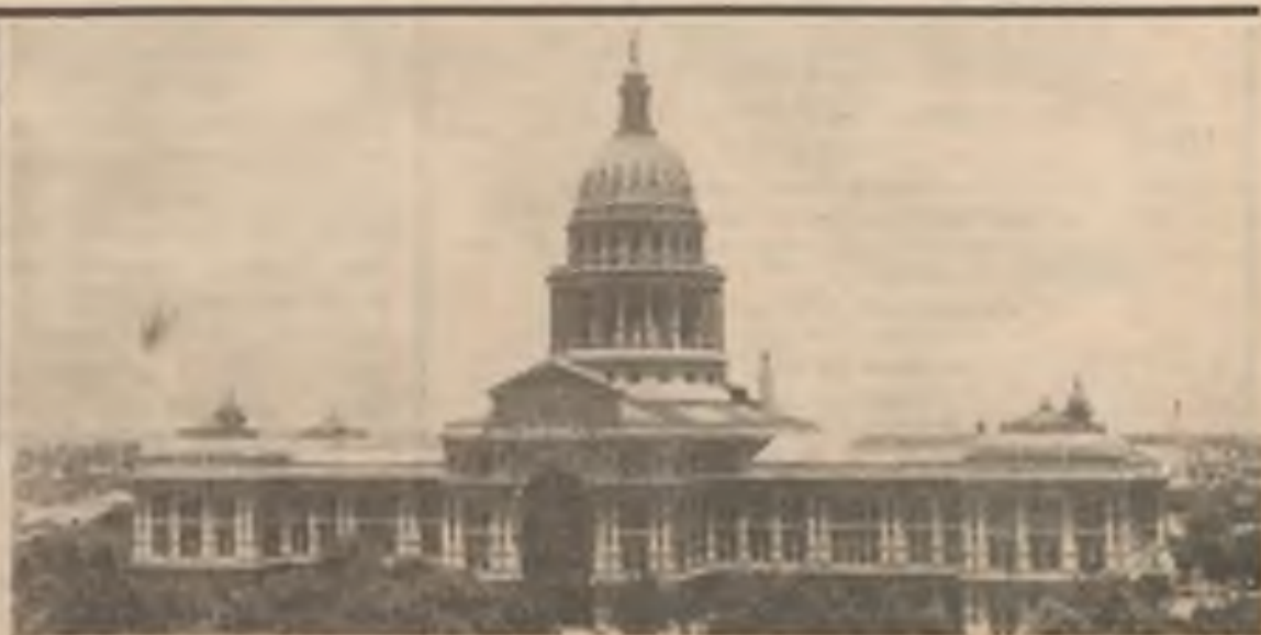
Státní kapitol ve městě Austinu, sídlo guvernéra a vlády státu Texas.

Na bitevním poli v San Jacinto jsou chronologicky vyličený hlavní dějinné události zápasu Texanů o nezávislost. Na žulových kvádrech jsou krátce popsány „momentky“ celé té dvacetiminutové bitvy, která rozhodla o texaské nezávislosti a svobodě.