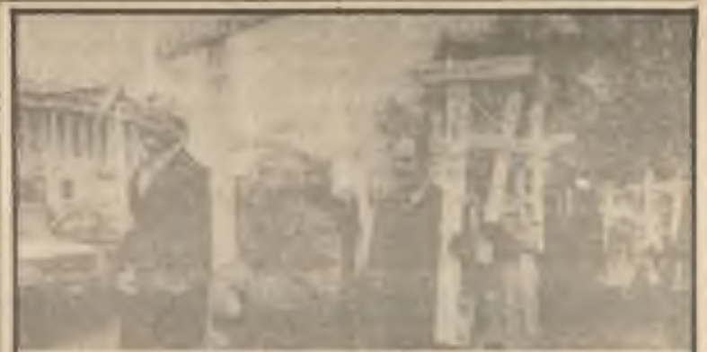
Zaběr z protestní manifestace nábož. představitelů proti pomoci obřacencům svobody v Nikaraguji, o které jsme obšírně psali v minulém Sloupku informací (roč. XI. č. 16 z 12.4.1986, str.2).

Těšíme se na shledanou v neděli 27. dubna 1986 ve 3 hod. odpoledne v Sokolovně na 71 ul. Školní výbor