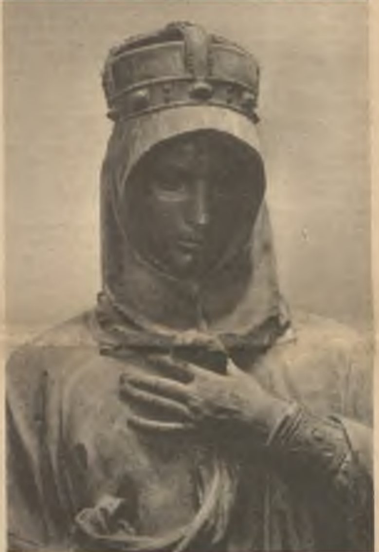
Sv. Ludmila, „matka našeho národa“. Detail Myslbekovy sochy z pomníku sv. Václava na Václavském náměstí v Praze.

Přes vše strádání uchovala si matka v rodině obyčejně i úkol chranitelky poesie a rodinného tepla a radosti. Již před sto lety chválí ji Palacký za tuto statečnost a utíkal se k ní často jako Kollár před otcovskou chladností. Proto snad, a méně spravedlivě, vzpomínáme i řídčeji na otce. Matky bývaly dětem nositelkami písní a estetických zážitků. Bylo by zajímavé publikovat zpěvníček jejich písní, jak na ně vzpomíná (Dokončení na str. 13)