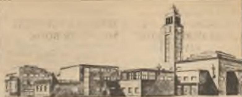
Projekt sales. díla v PRAZE VIII - KOBYLISICH. Ústav a kostel sv. Terezičky.

... »Kdybich vás tedy už neměl spatřit, tož vám s hlubokým pohnutím děkuji za všechny něžné projevy vaší lásky a prosím za prominutí, že jsem vám způsobil tolik obtíží. Denně prosím Boha, aby vás všechny bohatě odměnil. Vězte, že jsem vás vždy velice miloval, i když jsem se to někdy neodvažoval otevřeně vyjadřovat a pro naše dílo jsem byl připraven obětovat svůj život v kterékoliv době... rád bych zemřel jako věrně oddaný syn naší kongregace... Vyřídte nejpřímnější pozdrav a dík mojí nejmilejší mamince. Tolik trpěla na své životní pouti a nezažila žádnou opravdovou radost a já jsem jí nebyl schopen připravit žádné potěšení ...«