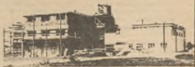
Stavba pražského ústavu a kaple (1936). K ústavu náležela též velká hřiště.