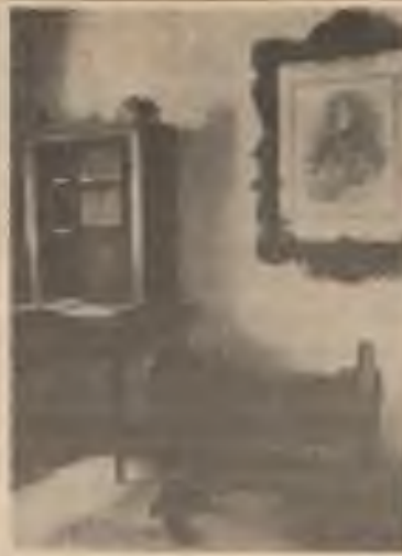
Rodná světnička Fr. Palackého v Hodslavicích.

Nejednou v poslední době slyšeli jsme hlasy, jež snažily se snížit hodnotu nacionálního hesla a nahradit je ideou domněle vyšší účinnosti; četli jsme dokonce, že vlastenectví je hříchem, nebo že s dobytím státní samostatnosti dobrála myšlenka národní svou úlohu. Svátek Palackého, který stal se otcem národa, protože národní myšlenka život posvětil, je jisté chvíli, kdy slovo na obranu nacionalismu je kusem povinnosti k památce toho, jehož vzpomínáme. Teoretikové, kteří mluví o domněle pouze negativním obsahu národní idey, nebo řekneme vlastenectví, zapomínají, že vlastenectví je láska, že je to tedy projev nejryzejší humanity, a že tato láska jako láska mateřská nepřije si ničeho vroucnější, než aby rodinu svou učinila účastnou všeho dobra a pokroku, k němuž dospěla doba. V tom