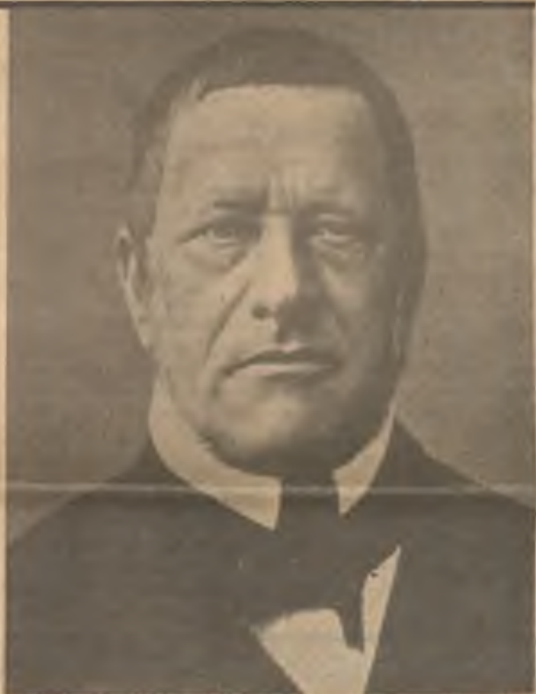
František Palacký (podle fotografie kolem r. 1860) (* 14. VI. 1798 v Hodslavicích na Moravě; † 26. V. 1876 v Praze; pohřben je v Lobkovicích.)

Ten zápas dobyvatele a buditele, jímž měl kmen polozapomenutý býti vrácen povědomí sebe, býti vyzbrojen novou vírou a novou nadějí a doveden k plnosti života národního, vedl Palacký víc než padesát let. Hlavní zbraní výboje byly české dějiny - Palacký zasvětil oddanou práci celého půl století nejen tomu, aby v díle po každé stránce klasickým vyloučil národu svému po prvé na