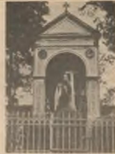
Hrob Fr. Palackého v Lobkovicích.

smyslu Palacký sám označil nacionalismus jako prostředek k závodění o vyšší mety kulturní, v tom smyslu napsal: nes-tačí býti Čechem, třeba býti Čechem vzdělaným, v tom smyslu rozuměti jest jedné z úvodních vět jeho předmluvy k Dějinám: Co z pravé lásky se prýští, nevysýchá nikdy, v tom duchu — Ale proč konečně ohlížet se po argumentech dalších, když celé dílo Palackého, celá ohromná práce doby probuzení až k jejímu úspěchu konečnému, je jediným nepřetržitým dokladem, jak úrodnou, jak mocnou, jak mravně výchovnou a kulturně požehnanou silou je láska národní, je nacionalismus! Je pravda: té přímo náboženské vroucnosti, již dal vlastenectví buditelů našich před stoletím romatismus, není již naše doba schopna; také nesmírný pokrok národní věci, jež spolu přineslo naše osvobození, přispívá k tomu, že potřeba důrazu na zřetel národní nejeví se tak naléhavou, event., že hlásí se potřeba upravit ráz, cíl a povahu jeho ve shodě s novou situací. Ale osudné by bylo zapomínati na to, že u nepřátel porážkou nacionalismus zesílil a naplnil se myšlenkou odvety, a že úkol náš, zisky osvobození zabezpečiti, je snad těžší než úkol buditelů — spustíme-li se nevázně záchranné kotvy, již je láska k národu svému a své vlasti, láska odhodlaná pracovati a mysliti o její lepší budoucnost, ta láska, jejíž mocí jsme své samostatnosti dosáhli, bude dříve či později veta po našem triumfu.