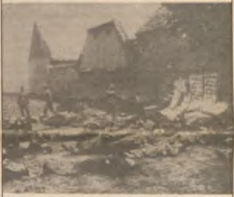
Mrtvá těla nacisty postřílených mužů na zahradě Horákova statku v Lidicích.

NEZAPOMÍNÁME NA NACISTICKÉ OBĚTI NAŠICH LIDIC Z DOBY 2. SVĚTOVÉ VÁLKY, ALE ZÁROVEŇ MUSÍME DNES MYSLIT I NA OBĚTI DESÍTEK NOVÝCH „LIDIC“ V AFGHANISTÁNU, BARBARSKY ZAVRAZDĚNÝCH KOMUNISTICKÝMI HORDAMI SOVĚTSKÝCH „OBRÁNCŮ MÍRU“.