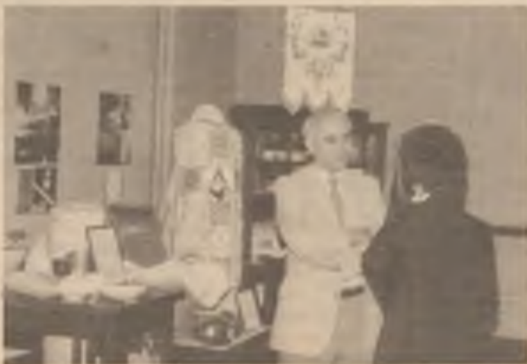
Visitors in the Heritage Room view memorabilia of yesteryear.

and St. Wenceslaus (Dodge) sang hymns during the distribution of Communion. Individuals from parishes and families associated with the Notre Dame Sisters sang the beautiful hymn „Tisickrát” as a communion meditation.