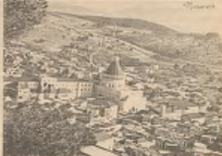
Dnešní město Nazaret v jižní Galileji, kde Nový zákon začal andělským zvěstováním Panně Marii, že porodí Ježíše Božího Syna.

Proto musím začít otázkou o tom, jak chápou smysl a podstatu života a světa. Především bych řekl, že život a svět chápou především jako člověk, který je sám prožívá, řekněme z lidského světového názoru. Lidský světový názor tu vědomě stavím proti takzvanému „vědeckému“. I ten pojem tu neuvoluji v onom groteskním smyslu, jehož nabyl v erární ideologii jednoho vývojově zaostalého impéria. Myslím to zcela věcně: „vědecký světový názor“ je způsob