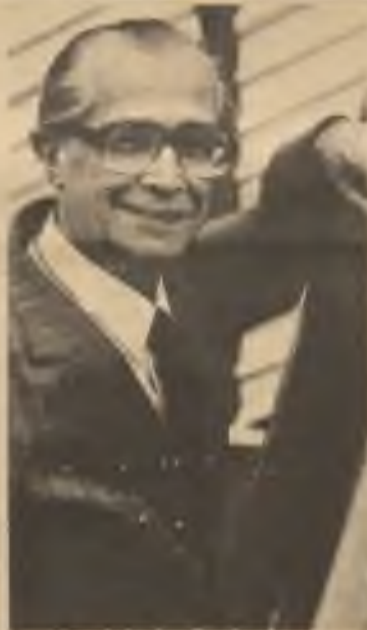
Kuba: portraying a forgotten people

In Czechoslovakia's case, this is a brave combination of liberal humanism and socialist fatalism - the two, sometimes contradictory, strains that have marked the country's postwar history. It is practical living out of this approach - its citizens making prudent daily adjustments to overwhelming realities - that has allowed the country and its culture to survive. This is a subtle ambience, much more difficult to capture than that of more flamboyant European Peoples such as the Italians, the Hungarians and the French. The Czechs have always managed to confuse their occupiers (and they have been occupied throughout modern times, except from 1918 to 1938) by practicing a brand of benign insurrection that amounts to collaboration, without surrender. The mixture of quiet levity and deter-