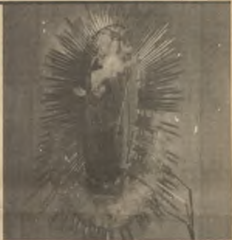
Socha Panny Marie Svatohostýnské v České národní kapli ve Washingtonu D.C.

Snad by také bylo prospěšné připomenout další účel České národní kaple: Posílení ducha národní a náboženské obrody všech Čechoameričanů a hlavně exulantů z Československa. Hlavně my Češi v exilu jsme velice známí svým „pokrokářstvím“ a náboženským nezájmem, tak dobře charakterizované už výrokem našeho básníka Viktora Dyka (1925), když o nich mluví, že „...byl to pokrok až ke zblbnutí!“ Někteří čeští liberálové v Chicagu, v New Yorku, ve Wisconsinu, v Omaze i v Texasu a jinde, nejen že moc uškodili českému jménu v USA i v zahraničí, ale navíc způsobili velké národní roztržiténí mezi emigranty a exulanty, kteří si zase přinesli do exilu svá politicko - stranická rozdělení. Tito pak nejen že mnoho nepřispěli na stavbu České národní kaple, ale stále rozsévají nespornost v českých kruzích a škodí našim společným národním zájmům. A jestliže T.G.Masaryk sám upozorňoval, že „státy žijí a udržují se ideami, z nichž vznikly“, bylo by už na čase a velice prospěšné, aby si to uvědomili i naši zbývající „svobodomyšlní“ a nechali ve svobodné demokratické americké zemi svobodně myslit i věřící, kteří jak za nacismu, tak i dnes za komunismu svými životními obětmi dokázali a dokazují, že jsou přinejmenším stejně věrnými národovci a dobrými vlas-