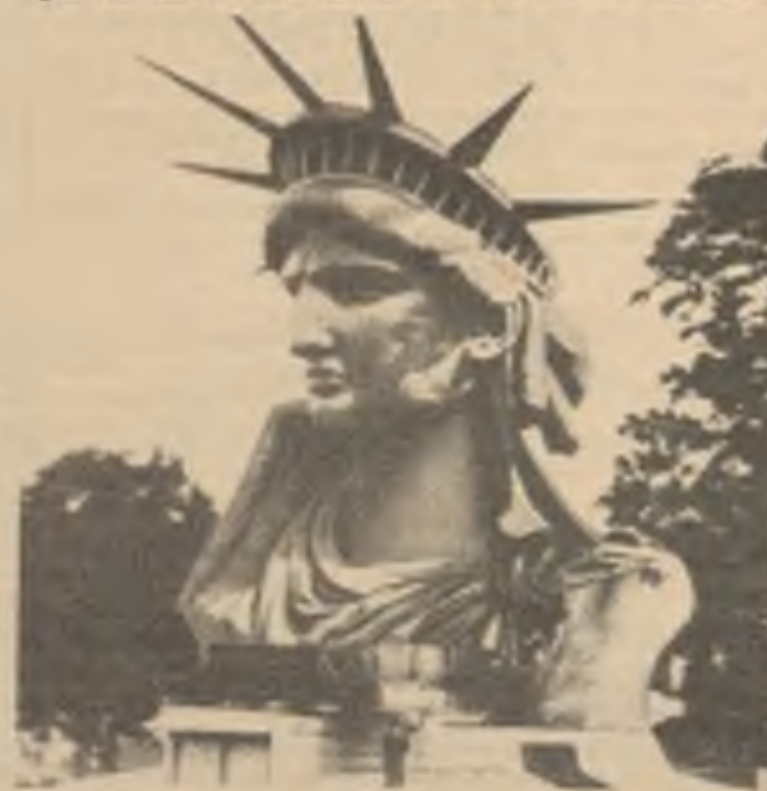
Hlava „Sochy Svobody“ vystavená v r. 1884 v Paříži před jejím odesláním do USA.

In 1886, Grover Cleveland was President, New York City was a thriving metropolis and the Statue of Liberty her newest jewel.