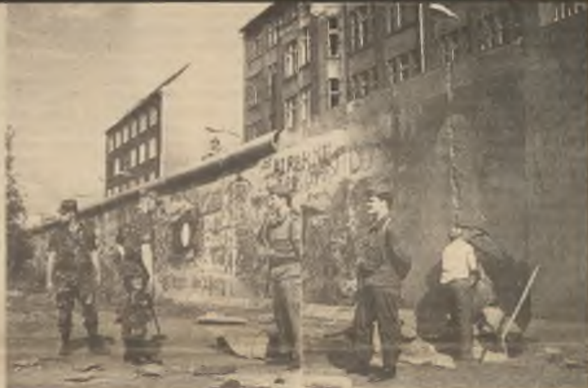
Začátkem letošního srpna některý občan Západního Berlína chtěl světu připomenout nestvůrnost Ber- línské zdi, a tak ji v jednom místě dynamitem podminoval. Příliš ji nepoškodil, ale alespoň protestoval. - Během uplynulého čtvrtstoletí bylo u Berlínské zdi zastřeleno přes 75 uprchlíků, 110 jich bylo zastřeleno na jiných místech hranic NSR-NDR a asi 5 tisícům se útěk podařil.

nikdy nemusely obehňovat zdi, aby své občany udržely uvnitř.“ - Komunistické režimy, které musí zabarikádovat hranice svých zemí, aby se jim lidé nerozutekli jsou tedy zřejmě špatné a nedobré režimy.