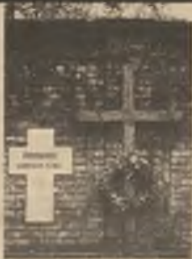
Západní Berličané pietně označují místa, na kterých se i neznámým up- rchlíkům nezdaril pokus o útěk z NDR, protože byli východoněmec- kou pohraniční stráží zastřeleni.

Pak vyhraje svou kvalitou bez jediného výstřelu! Jak to řekl president J.F. Kennedy, když stál v r. 1962 u Berlínské zdi: „Svoboda má mnoho chyb, ale jsou napravitelné. Demokra- tické země se však dosud