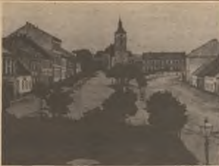
Náměstí v Proseči. - Hostinci vpravo od kostela se říkalo „Na Horničce“.

Vysvětlení je prosté, ale události předtím jsou složité. Oba bratři spisovatelé byli zbaveni občanství Hitlerem, a tím se stejně jako jejich rodiny,