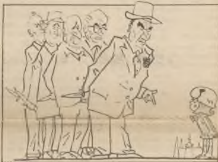
V druhém zvláštním vvdání z 27. srpna 1968 si ještě dovolil jinak komunistický týdeník humoru Díkobraz otisknout na titulní stránce tuto karikaturu o proradnosti pěti bratřích s titulem: Pohádka o pěti bratřích.