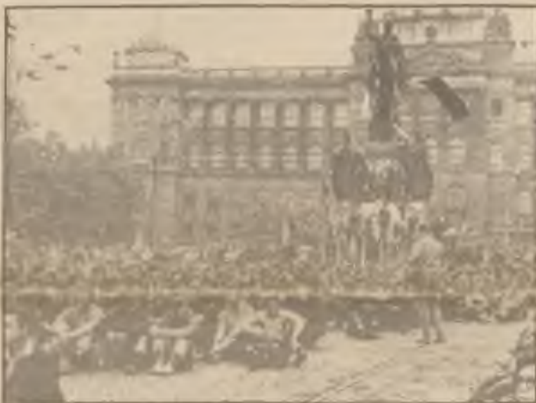
Mladí tehdy klidně demonstrovali na Václavském náměstí kolem Myslbekova pomníku sv. Václava proti příjezdu sovětských tanků tím, že poklidně seděli na postranství náměstí před Národním museem.