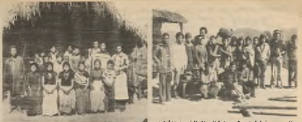
V takovýchto chatrčích bydlí naši zdejší svěřenci...