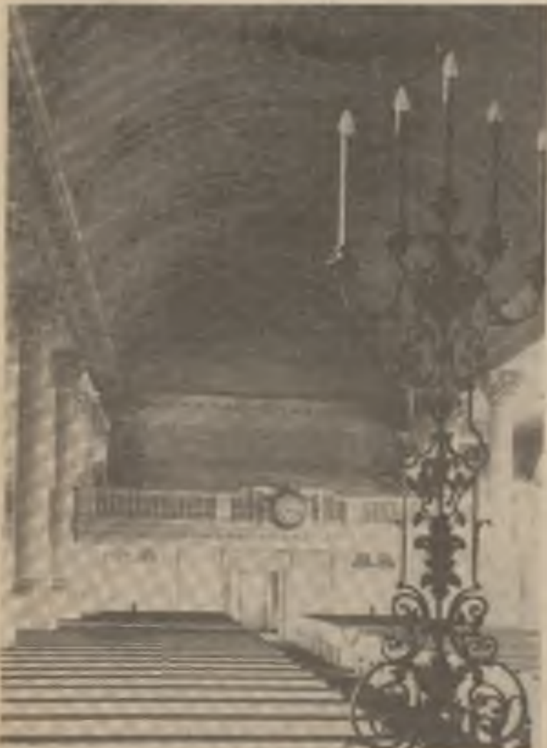
Historická „Memorial Chapel“ Harvardské university.