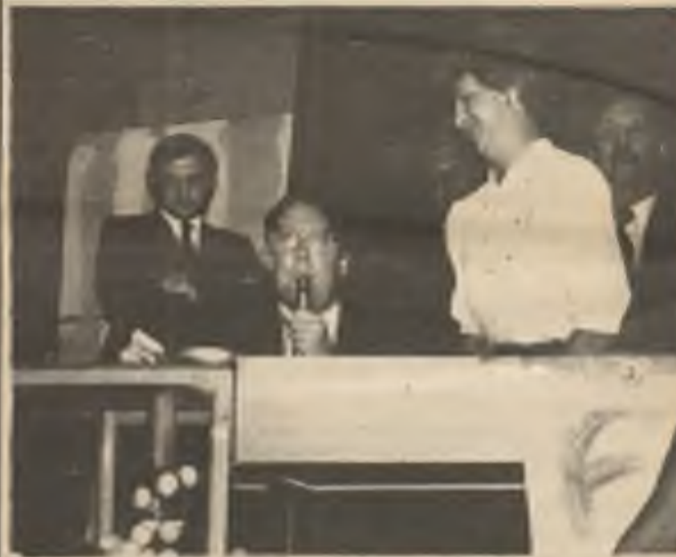
State Senator Walter W. Dudyecz (R-7, Chicago) (Left) looks on as Governor Thompson calls a bingo game at St. Patrick's High School on Chicago's northwest side. The governor took the occasion to sign into law the bill allowing „Las Vegas Night” style charitable fundraisers. The bill, cosponsored by Dudyecz, permits charitable, religious and educational groups to conduct up to four casino-type fundraisers per year. The ceremony was held Tuesday night (August 19th).

Wisconsin Glacial Bus Tour - This tour focuses on the fascinating geological landscapes of Kettle Moraine State Park, and includes short walks along Wisconsin's beautiful countryside.