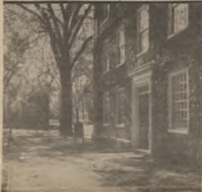
Ačkoliv původní budova Harvardovy koleje už neexistuje, její první přístavba „Massachusetts Hall“ z r. 1720 dosud stále slouží svému účelu.