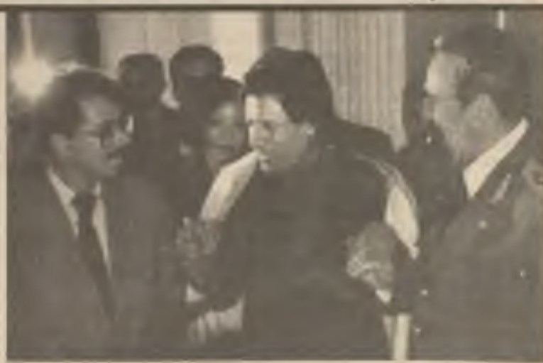
Tři komunističtí diktátoři - nikaragujský Daniel Ortega, libyjský Muammar Gadhafi a Fidel Castro z Kuby - v přátelské debatě.

V poslední době se Mugabe také snažil být činným v