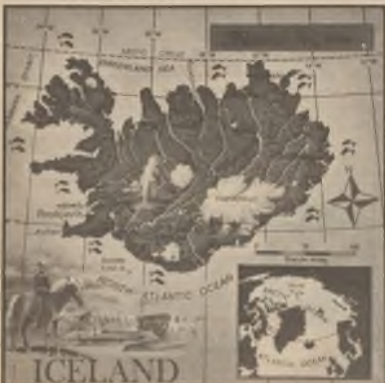
Sopečný ostrov Island v severním Atlantickém oceánu, 200 mil východně od Grónska. hned pod Polárním kruhem, byl obydlen Vikingy už v druhé polovině 9. století.

bačovem nyní jednat jaksi z pozice síly, protože svým přijetím pozvání na „mini-summit“ pomohl Gorbačovovi „zachránit fasádu“ vůči komunistům staré gardy v Kremlu, kteří ve věci nukleárních zbraní nechtějí Spojeným státům učinit žádné ústupky. Gorbačov prý musí dosáhnout na vrcholné konferenci alespoň některých skutečných úspěchů. SSSR věnuje totiž na zbrojení celých 15 procent svého hrubého národního důchodu, zatímco USA