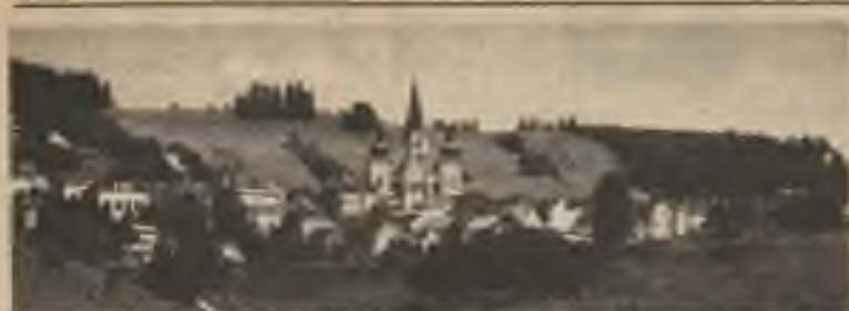
Gruß aus Mariazell, Steiermark