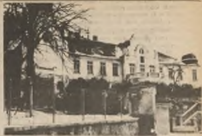
RADVANOV (Jižní Čechy). Zde byl nějaký čas (1963-1968) internován i litoměřický biskup spolu s p. kardinálem BÍRANEM a jinými českými a slovenskými preláty.

Myslím však, že ji již máme a že ji nosíme v sobě. Je třeba jen mít odvahu k ní se přihlásit. Věc vyžaduje ale delšího rozboru a odůvodnění. To bude druhou částí načrtnutého programu, a doufám, že vám ho budu moci při blízké příležitosti předložit. Zatím vám chci jen tolik prohlásit a všechny vás zapřisáhnout: