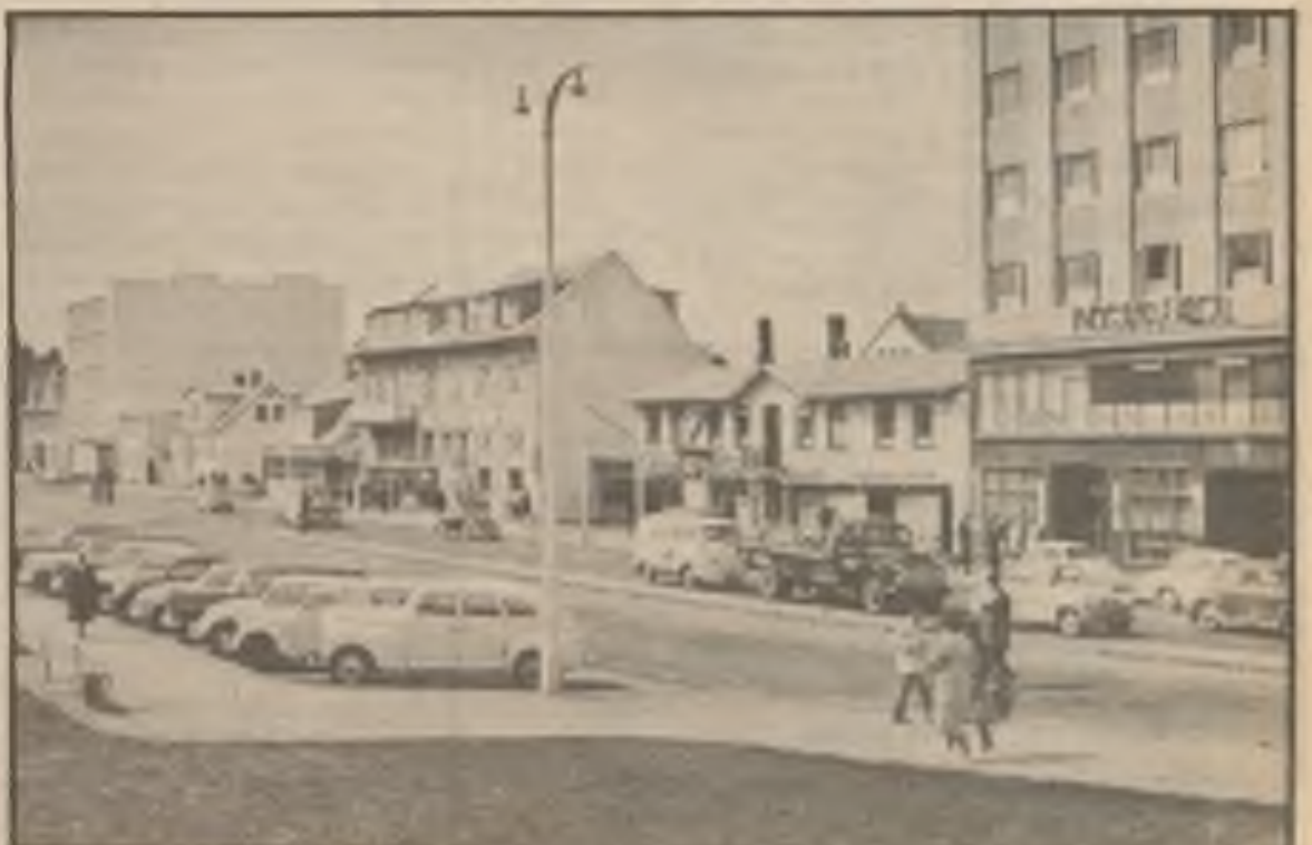
Jedna z ústředních ulic Reykjavíku, hlavního města Islandu, kde se v sobotu 11. a v neděli 12. října 1986 seje US prezident R. Reagan s gen. sekretářem KS SSSR Gorbačovem k přípravě pozdější vrcholné konference.