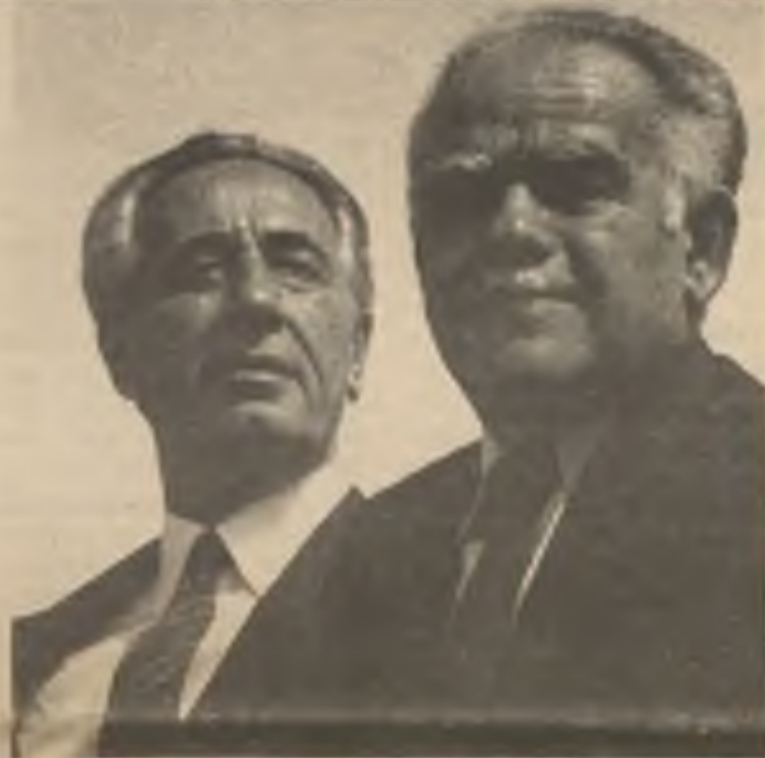
Vůdce izraelských socialistů Shimon Peres odevzdal otěže vlády svému odpůrci Y. Shamirovi.

V těchto posledních týdnech Peres vyvinul čilou diplomatickou aktivitu ve snaze získat si velkou přízeň izraelského voličstva, aby po příštích volbách mohl dále pokračovat ve své funkci ministerského předsedy. Mohl by totiž vyhlásit i předčasně nové volby, při kterých by jeho strana mohla zvítězit. Peres však neměl v této své snaze žádný úspěch; proto byl někdy posměšně nazván „kulhavou kachnou“. Schůzí s egyptským prezidentem Mubarakem se snažil o zahájení nové mírové iniciativy na vyřešení palestinského problému. Pro své nové mírové snahy se pokusil získat si Egypt, Spojené státy, Jordánsko, Sovětský svaz i Palestince. Mimo pronesení mnohých vzletných slov se na této schůzi však ničeho konkrétního nedosáhlo. Peres se také marně pokoušel jednat se Sověty o znovunavázání diplomatických vztahů mezi oběma zeměmi a o dosa-