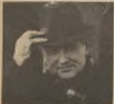
US president Reagan s diktátorem Gorbačovem se v islandském Reykjavíku sešli, aby se zase rozešli... Ovšem, jen žádný strach! SSSR bude rád vyjednávat dál, jakmile rozpoznal odhodlanost USA - nedat se!

Politické spory uvnitř strany Likud, anebo neshody mezi Likud a stranou práce uvnitř koaliční vlády by mohly v budoucnu přivodit pád izraelské vlády a tak případně vyhlášení nových voleb. Zdá se však, že v přítomnosti nikdo o nové volby nestojí, protože nikdo neví, jaký by byl jejich výsledek, a nikdo z izraelského parlamentu nechce riskovat svou politickou budoucnost.