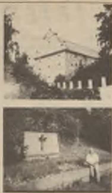
Oltář sv. Václava v řestockém kostele. Nahoře: bývalý panský špýchar; pod ním: poutník odpočívá u památníku umučených vlastenců na Ležákách z 2. světové války; vpravo nahoře: kostel sv. Václava v Řestokách a vedle průčelí kostela sv. Maří Magdalény ve Včelákově; dole: kopie obrazu zřícenin hradu Žumberka ze západu.