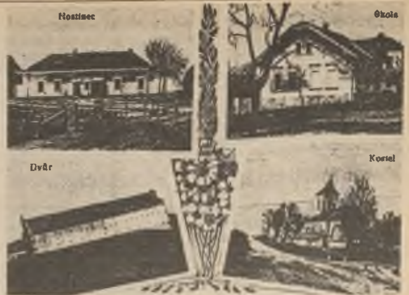
Pozdrav z Řestok poslaný na válečnou frontu v r. 1917, který se po válce vrátil, protože voják-adresát padl v boji za svobodu našich obou národů.

šimavě propouští její vodu na další pout'. Její dosavadní klid, který je vyhledáván rekreanty z Chrudimi a Pardubic je náhle přerušen mohutným lomozem drtičů a různých transportérů a jiné mechanice zdejších kamenolomů. Hluboké údolí, nad nímž ční zřícenina hradu ze 14. století, stále více se rozšiřuje, kameníci neúnavně obnažují tvrdé skály a zakusují se do jejich útrob, mění je na drobný štěr a v obalovnách připravují horký asfalt pro stavbu a výstavbu silnic a místních komunikací. Výstražné sirény čas od času ohlašují blízký odstřel horniny. Po něm následuje silná detonace, spojená při komorovém odstřelu i se záchvěvem země. Lidé, ptactvo, zvířectvo z blízkého okolí si již na tyto rány zvyklo. Jen cizí sebou trhnu, když klidně sedí a najednou se ozve rána až zařinčí sklo u oken. Také říčka Holetínka na tento nezvyklý ruch nijak nereaguje a klidně běží dál údolím směrem k Bítovanům.