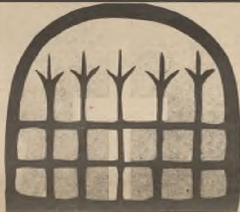
V historii Evropy 20. stol. zůstanou dozajista léta novodobého rafinovaného pronásledování věřících křesťanů marxisticko-komunistickými ateisty nejdůležitějším duchovním průsečíkem symbolicky výstižně znázorněným tímto obrázkem a rakousko-bavorskými Alpami.

Je proto přirozené, že nám působí velké obavy stále a zřejmé překážky, nátlak a dokonce pronásledování, jímž jsou vystaveni věřící v ČSSR. Právě proto, že máme zájem na dobrých sousedských vztazích mezi našimi národy, nemůžeme mlčet k pohrdání lidskými právy a základními svobodami, především svobodou vyznání, jakož i k porušování závěrečného aktu Helsinských dohod v ČSSR. Nemlčíme ani k témuž a podobnému bezpráví v Jižní Africe, v asijských zemích nebo v latinsko-amerických státech. Stejně tak nemůžeme mlčet, jsou-li lidé pronásledováni pro své nekomunistické politické přesvědčení, anebo šlape-li se po jejich lidských právech. Pozvedáme proto právem svůj hlas i tehdy, když se z ideologického