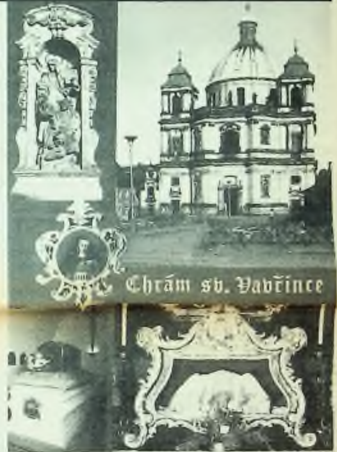
Barokní chrám sv. Vavřince v Jablonném v Podještědí, zbudovaný nad hrobem paní Zdislavy z Lemberka, zakladatelky původního kostela, zasvěceného sv. jáhnu Vavřincovi už v 13. století.

Hradiště a malá osada Jablonné stávaly v tom kraji už o několik století dříve. Bylo to