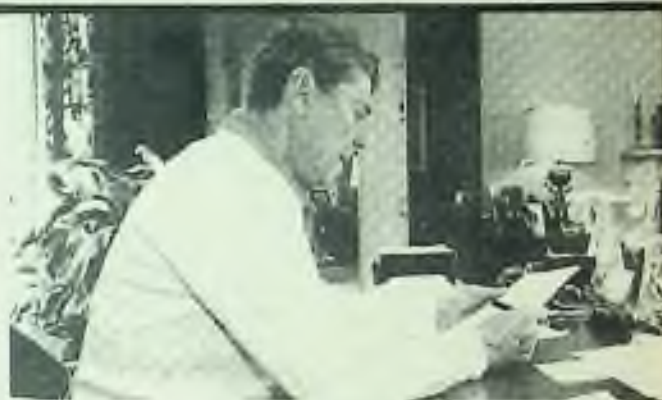
Když se US president R. Reagan připravoval na svou letošní výroční řeč před Kongresem o stavu americké Unie...

Pak prezident pojednal o hlavních zahraničních problémech. Řekl, že Sověti zůstávají nejvážnějším ohrožením svobody pro Spojené státy a ostatní demokratický svět. Sovětský svaz s neúprosnou rozhodností usiluje o rozšíření své moci všude na světě. V pos-