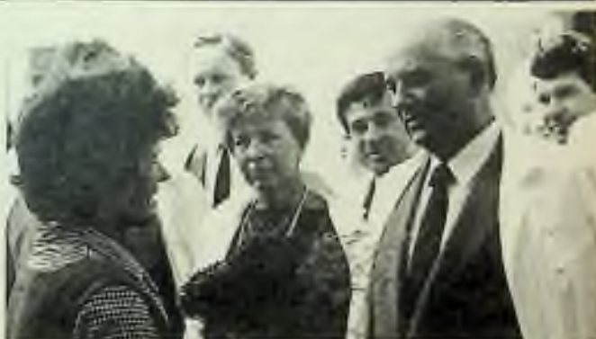
Soudruh Gorbačov s chotí Raisou chtějí sovětským lidem dokázat, že mají živý zájem o jejich denní životní problémy, a tak navštěvují i kolchozy.

Už bylo několikrát opakováno, že Gorbačov se pokouší zavést do upadající sovětské marxistické ekonomie některé kapitalistické praktiky. Před dvěma týdny Kreml oznámil, že cizí firmy budou moci vlastnit až 49 % hodnoty ekonomických podniků, které v SSSR založí ze svých investic. Budou se těšit i výhodným daňovým úlevám a budou nezávislé na sovětských ekonomických plánovačích. Už tři americké firmy, Monsanto, Occidental Petroleum a SSMC - Singer, vyslovily písemně zájem o tyto smíšené socialisticko - kapitalistické pokusy. Čeká se, že asi tucet dalších firem bude následovat jejich příkladu. Monsanto by chtěl založit továrnu na chemikálie v Kazachstanu proti plevelu. Occidental by chtěla spolupracovat na sekundární těžbě zemního oleje v kraji Volhy, a firma SSMC - Singer by chtěla vyrábět šicí stroje v Bělorusku. Mnohé otázky však dosud zůstávají