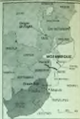
Sousední země Angoly a Mozambiku nad JAR.

Když v roce 1975 po obržzení nezávislosti Angoly na 300,000 Portugalců musilo zemi opustit, tamní ekonomie se ocitla v úplném zmatku. Marxistická vláda pozdě uznává, že tehdy se