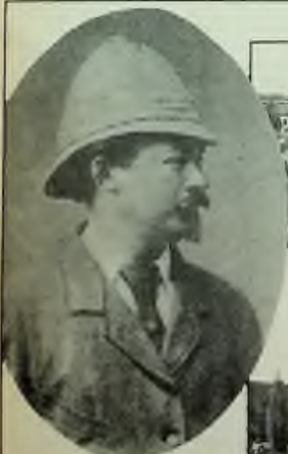
* 7.10.1847 † 21.2.1902 MUDr. Emil Holub