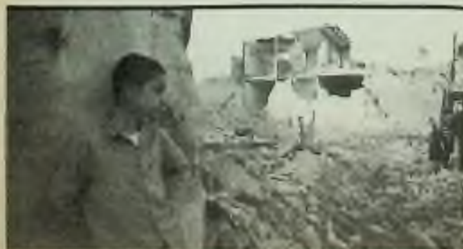
„Co nás čeká?“ - ptají se děti v Teheránu i v Bagdadu.