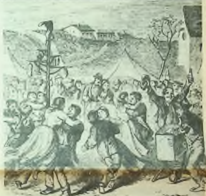
Tanec na pouť ševcovského cechu zv. Fidlovačka (1869)

álení Mistra Jana Husa v Kostnici. Na všechna tři místa se věčně pamatovalo za Masarykovy a Štefánikovy republiky. Před pěti lety - v r. 1982 - jsme u příležitosti 120. výročí Škroupovy smrti - věnovali jeho záslužnému dílu titulní stránku H.N. a přinesli jsme tehdy s jeho podobiznou i fotografii jeho hrobu v Rotterdamu a obrázek světnice z pražského domu v Myslíkově ulici čp. 187 s postelí, na které umírala jeho milovaná žena, a stolem, na němž dokončoval skladbu písně na Tylův text „Kde domov můj“, jež je dodnes náš národní