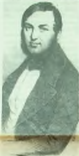
František Škroup (1847)

Škroupův hrob na Ústředním hřbitově v Rotterdamu není tak docela opuštěn, stejně jako není zapomenut hrob Mistra Jana Amose Komenského v Naardenu u Rotterdamu, a místo up-