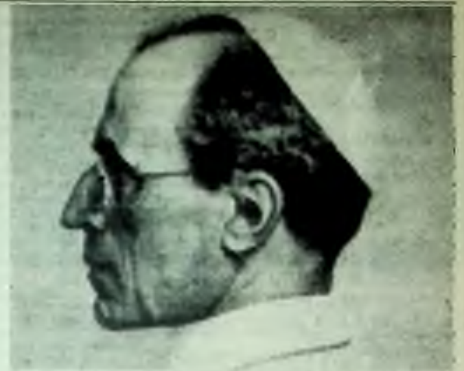
PAPEŽ PIUS XII. - (EVŽEN PACCELLI) - (1939 - 1958)

V této věci papež tedy sledoval za daných okolností svůj zdravý rozum, osvěcený křesťanskou vírou, a volil cestu spíše moudrosti než nesmyslnou cestu divadelního efektu. Za daných okolností - kterým jeho kritikové ve svém klidu „za peci“ vůbec nerozumějí - papež