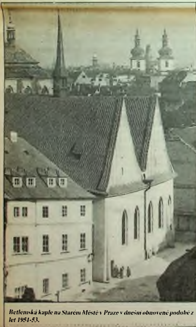
Betlémská kaple na Starém Městě v Praze v dnešní obnovené podobě z let 1951-53.