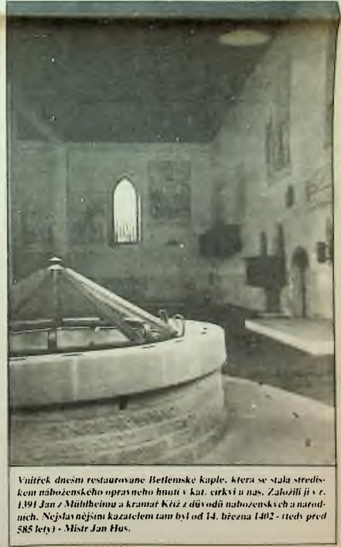
Vnitřek dnešní restaurované Betlémské kaple, která se stala středis-tem náboženského opravného hnutí v kat. církvi u nás. Založil ji v r. 1391 Jan z Mělníka a kramář Kříž z důvodů náboženských a národ-ních. Nejslavnějším kazatelem tam byl od 14. března 1402 - (tedy před 585 lety) - Mistr Jan Hus.