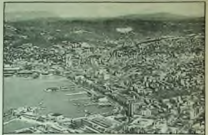
Celkový pohled na jadranské přístavní město Terst (italsky Trieste, německy Triest a starolatincky Tergesto). Římané si město podrobili už v r. 177 př. Kr. a za císařské doby je zvelebili. Pro neustálý spor s Benátkami se už v r. 1382 město poddalo rakouskému vévodovi Leopoldu III. Jeho rozvoj začal po r. 1719, kdy Rakousko prohlásilo Terst za svobodný přístav.