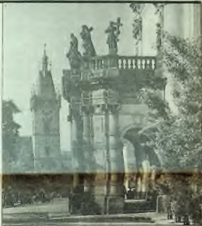
Karlovo náměstí v Praze: v pravo je známý barokní chrám sv. Ignace z Loyoly, který spravovali do r. 1950 Otcové ješuité, a uprostřed ob- rázku je věž bývalé Novoměstské radnice s bývalou přílehlou věznicí, kde se konal vloni typicky ustrašený proces s českými věřícími vzd- ělanci, kteří se už v dnešním čs. komunistickém režimu nebojí hlásit se veřejně k víře v Krista.